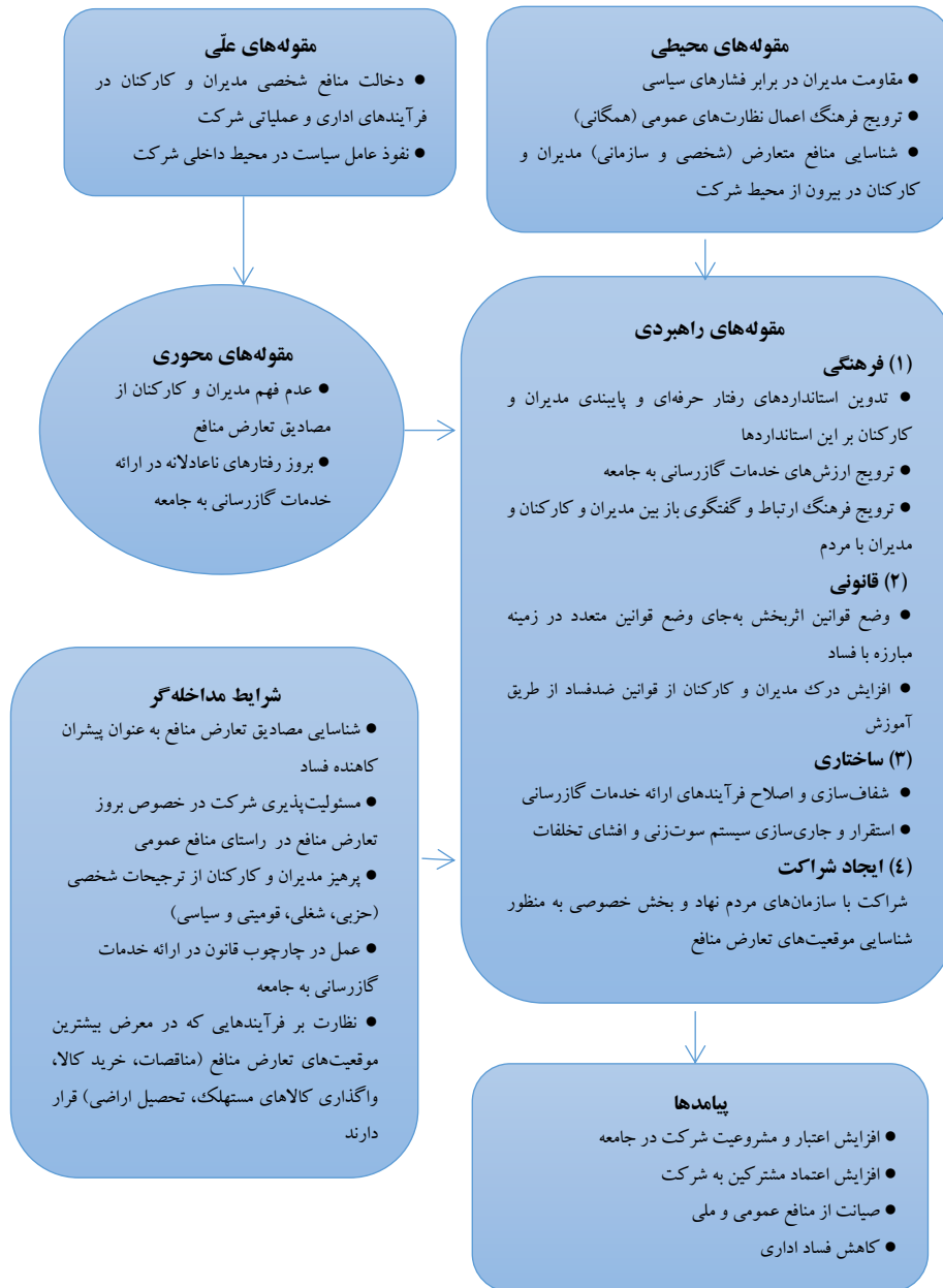
شکل ۱. الگوی پارادایمی پژوهش